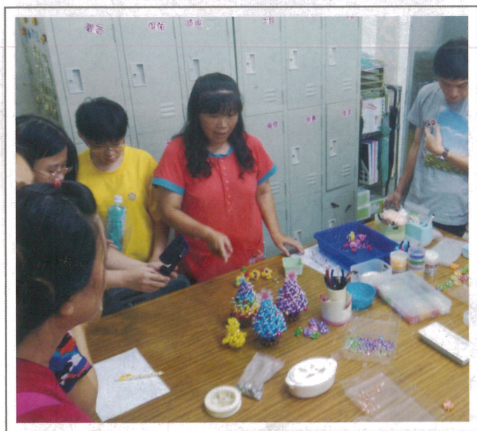
老師細心指導孩子們完成串珠作品。