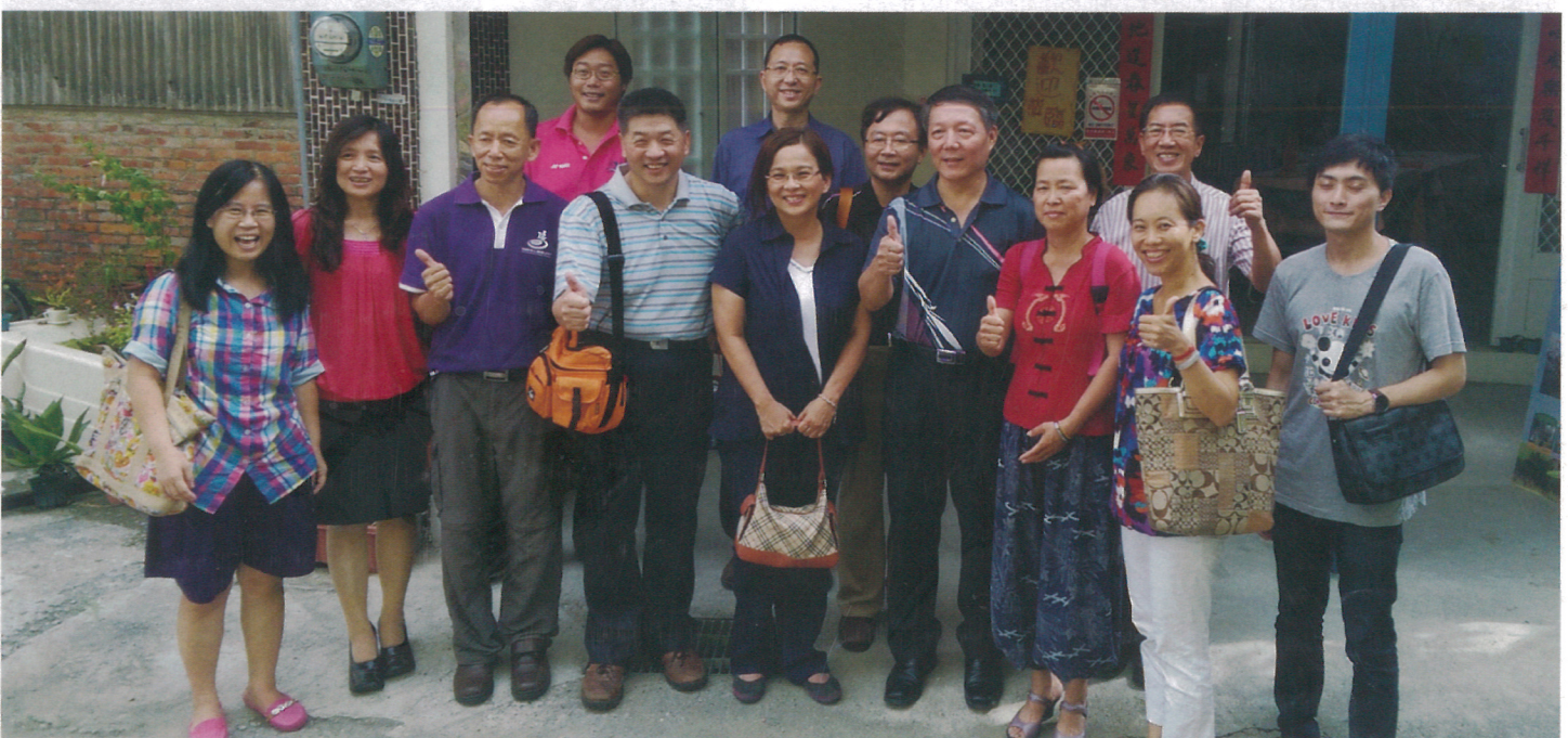
一群來自各地方的家長，參觀不同的小作所汲取經驗，希望能帶回當地，幫助更多特殊兒童增加謀生能力。