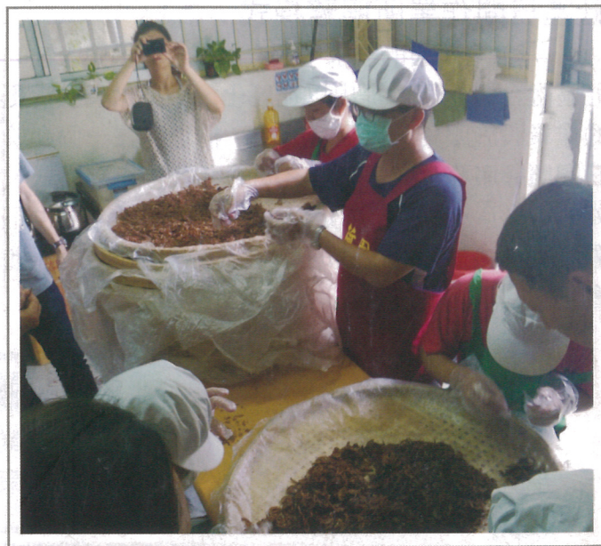
廣受歡迎的檸檬乾供不應求，更有人買回日本與親友分享。