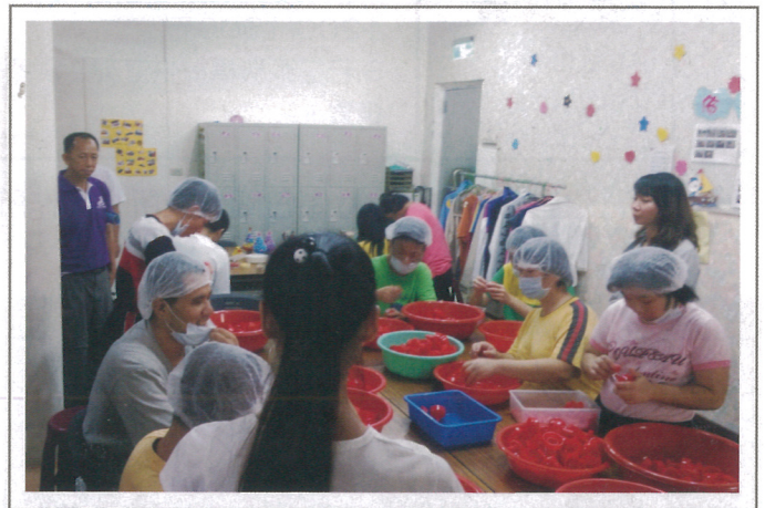
為了提升謀生能力及經濟來源，孩子們都努力在代工廠作業。