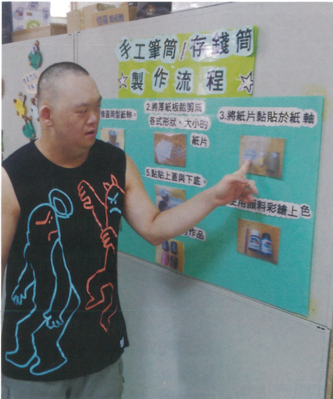
小作所的孩子認真為客人簡介工作內容。