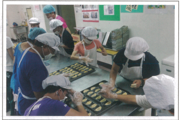
孩子們專注在鳳梨酥製作。

基於身障者的需求，政府在符合平權與人性的社區融合概念下，提出以 社區化、小型化與生活化 的作業設施服務來滿足其需求，構思建置一個介於 日間照顧服務及庇護工場 之間的社區化作業模式，如圖1所示，讓能力不足以進入庇護工場，但也不願意接受機構日間服務的身障者，有更好的選擇機會。