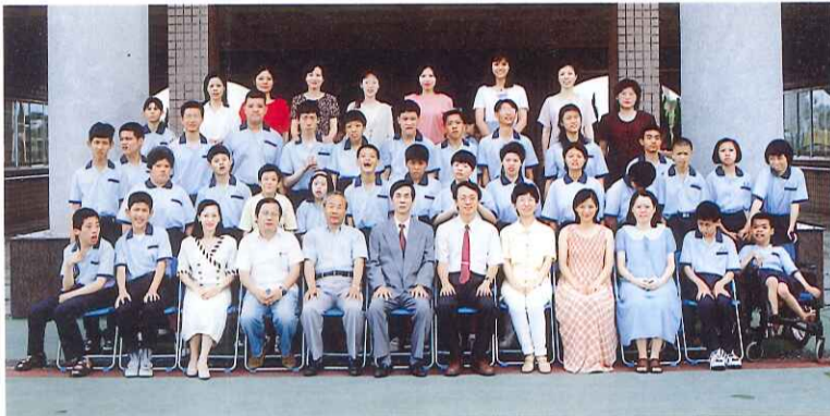
國三畢業生與師長合影