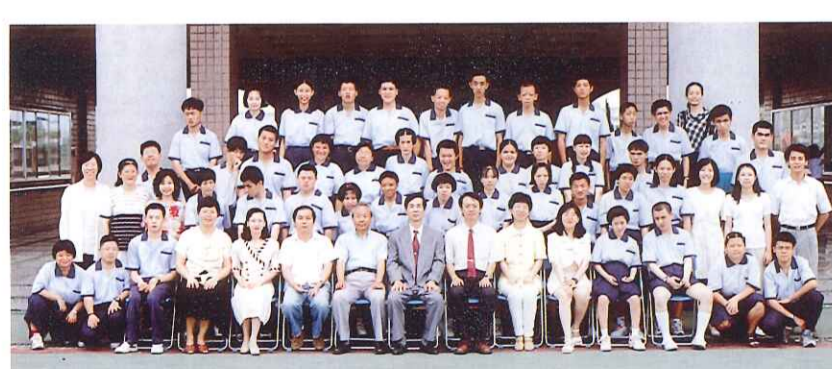
高三畢業生與師長合影