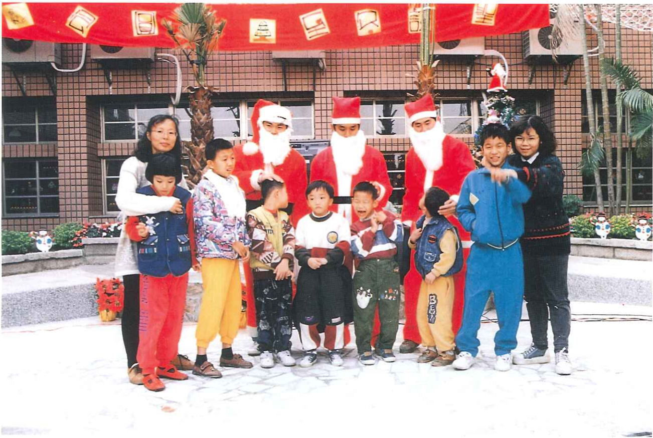
聖誕節前夕本校特地舉辦「聖誕冬至湯圓會」，一百零三位同學在老師的指導下，從認識湯圓、搓湯圓到吃湯圓，歡樂無比，更有聖誕老公公分贈禮物，現場洋溢溫馨的聖誕味。

發行人：邱明發 編輯：編輯小組 發行所：省立嘉義啓智學校 地址：嘉義市大同路100號之1 電話：(05)2858549 承印：蘭潭彩色印刷