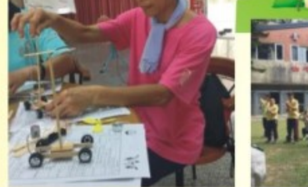
慈善童軍輔導員行前訓練營