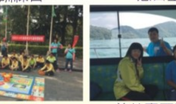
慈善童軍體驗營-船遊日月潭體驗