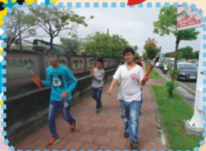
106中小聯運聖火傳遞