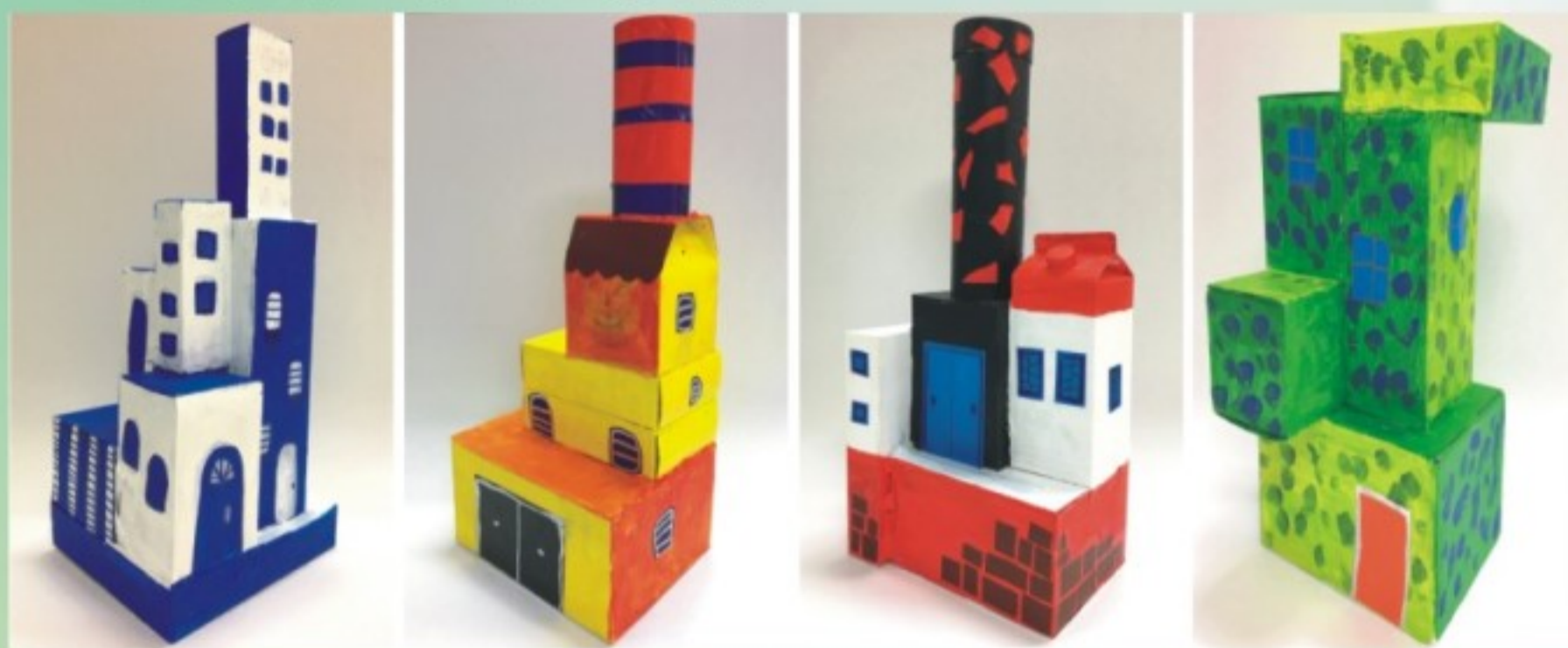
建築之旅-紙箱屋創作

本學期藝術與人文領域「建築之旅」單元，介紹古今中外的特色建築物的欣賞課程，並讓學生發揮創意以紙箱進行拼接，創作出各式建築結構，藉由裝飾技法，呈現色彩繽紛的紙箱屋。