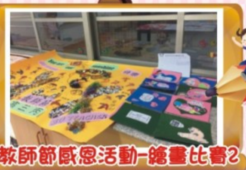
教師節感恩活動-繪畫比賽2