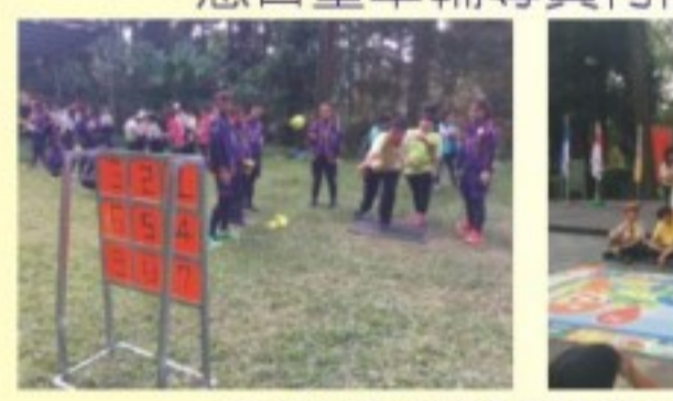
慈善童軍體驗營大地活動