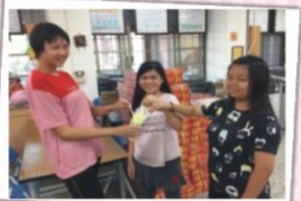
嘉特小市長候選人抽籤