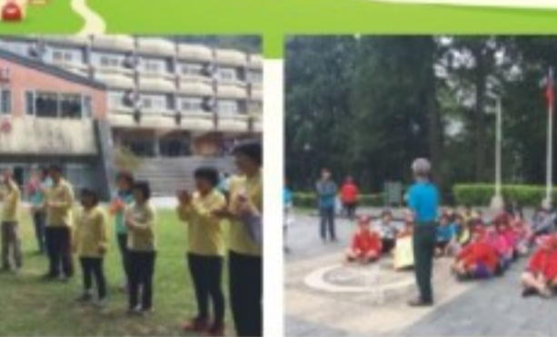
慈善童軍體驗營大地活動