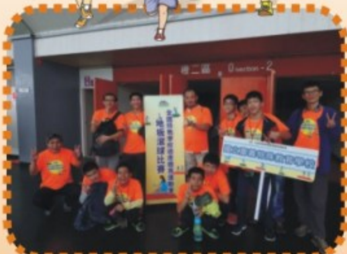
2017全國特教學校適應體育運動會