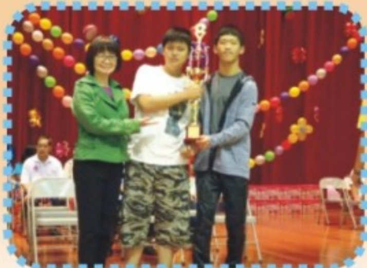
嘉義市身心障礙運動會 地板滾球觀摩賽獲獎