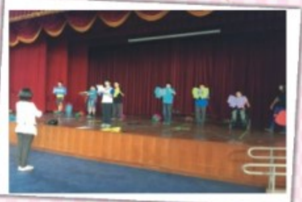
小市長競選政見發表會彩排2