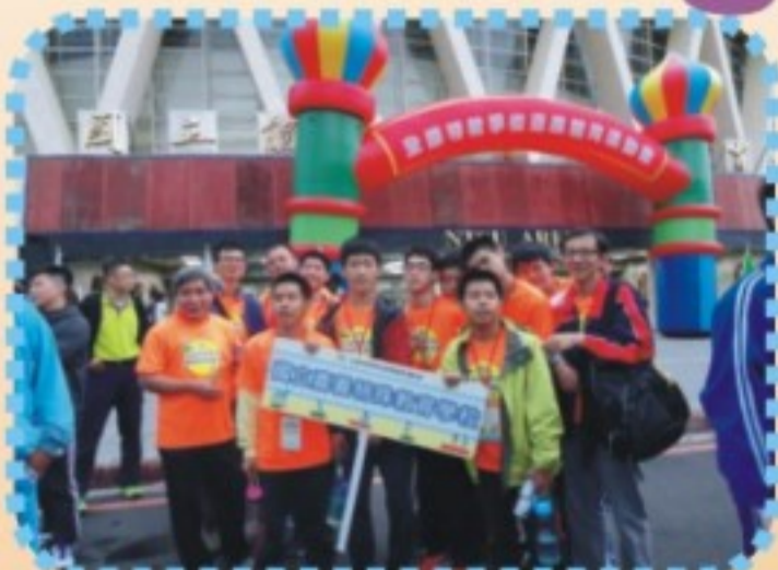
2017全國特教學校適應體育運動會(2)