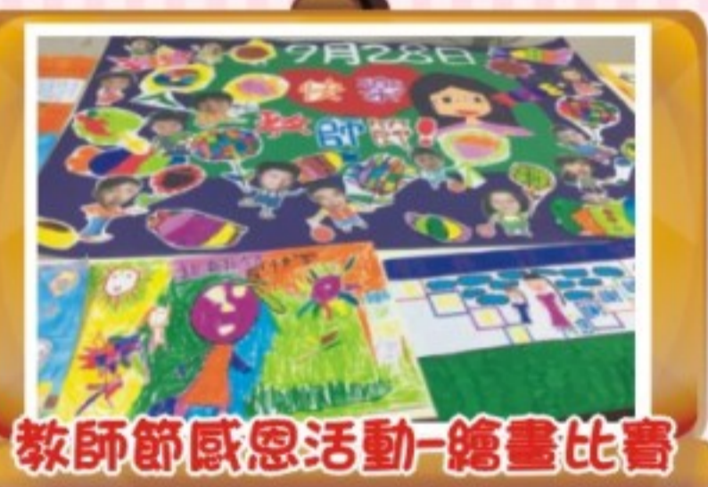
教師節感恩活動-繪畫比賽