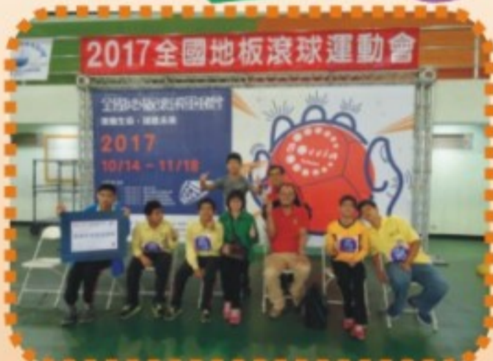
2017全國地板滾球運動會