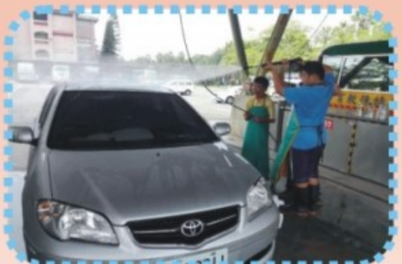
基礎汽車美容實務課程