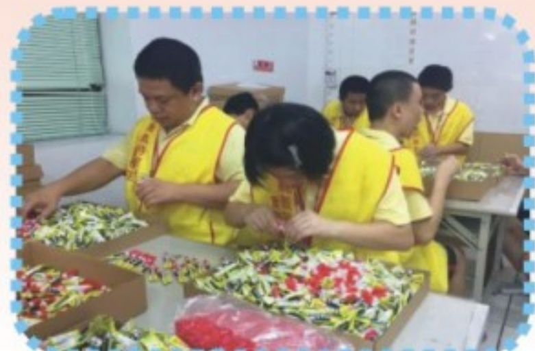
裝配代工實務課程