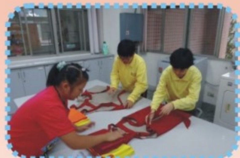
衣物清潔與整理課程