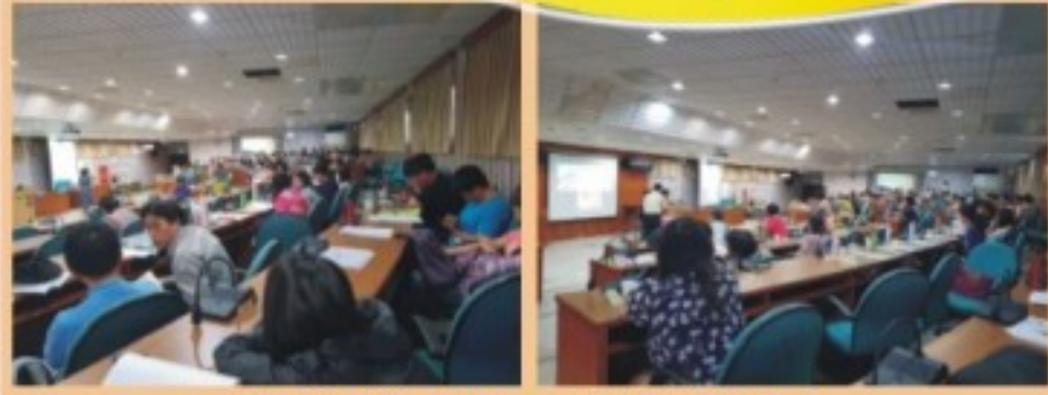
全校性別平等講座