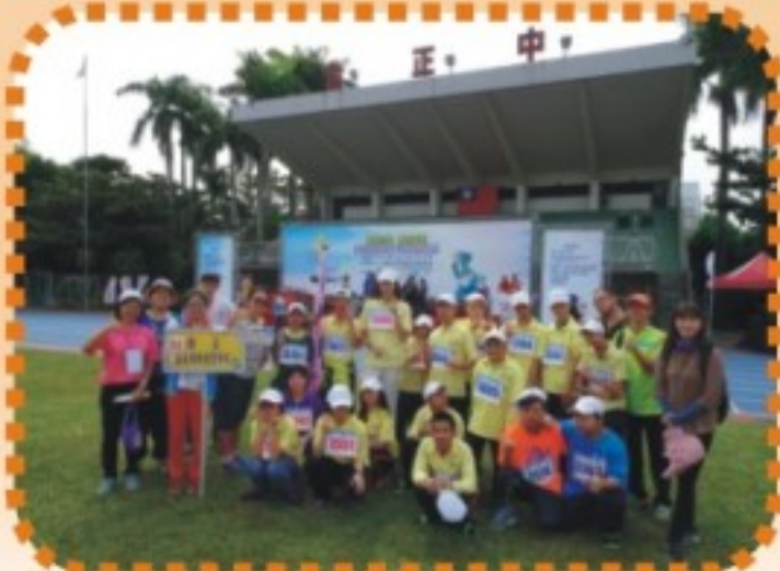
第七屆中南區亞特盃運動會