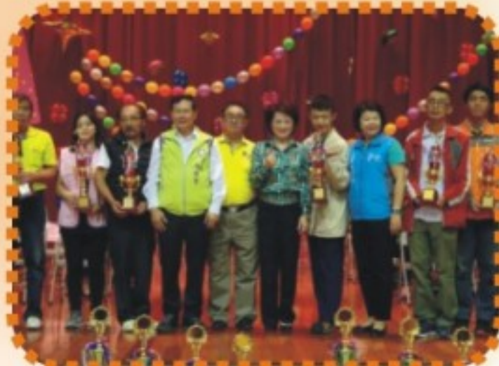
嘉義市身心障礙運動會 保齡球比賽獲獎