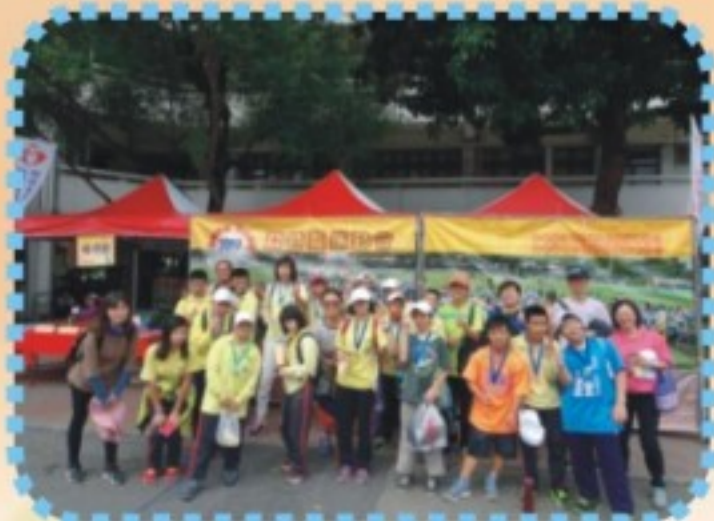
第七屆中南區亞特盃運動會(2)