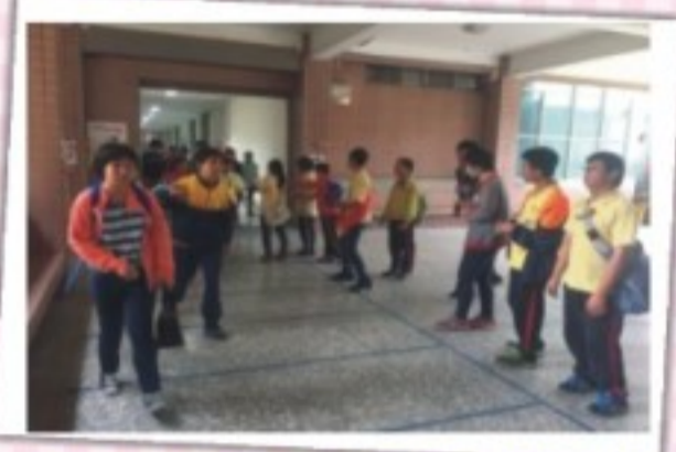
小市長競選拉票活動2