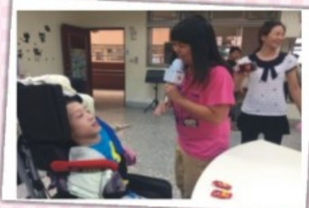
小市長競選拉票活動