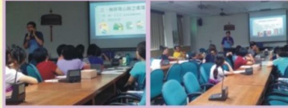
校車司機及隨車性別平等研習