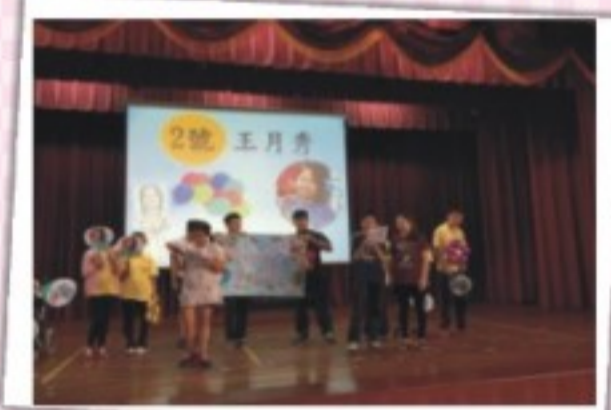
小市長競選政見發表會彩排