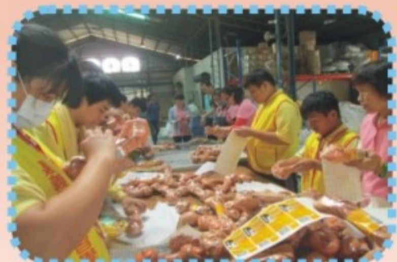
皮革工廠包裝組裝實習課程