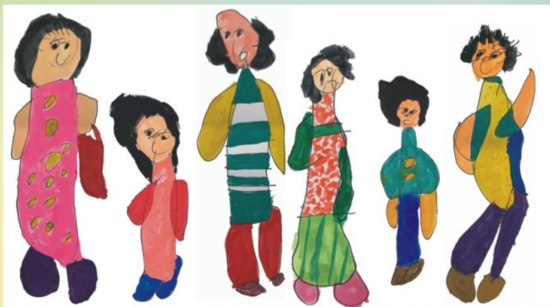
水彩速寫-人物造型創作

指導學生觀察人物動態，嘗試人物速寫創作，在勾畫出線條輪廓後著色，並將作品組合，表現人物造型的趣味。