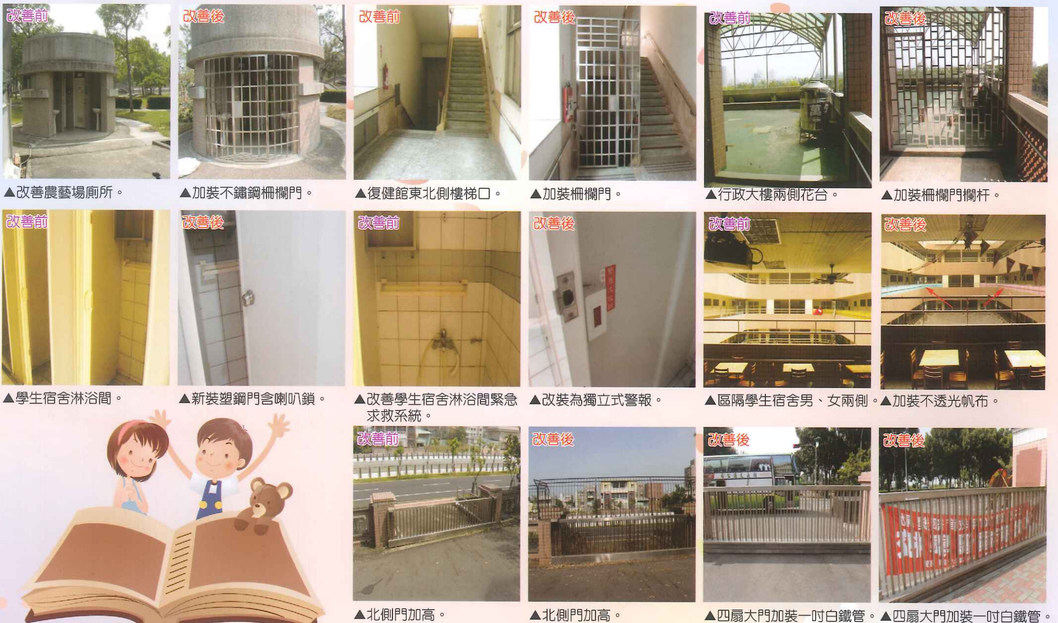
▲改善農藝場廁所。 ▲加裝不鏽鋼柵欄門。 ▲復健館東北側樓梯口。 ▲加裝柵欄門。 ▲行政大樓兩側花台。 ▲加裝柵欄門欄杆。 ▲學生宿舍淋浴間。 ▲新裝塑鋼門含喇叭鎖。 ▲改善學生宿舍淋浴間緊急求救系統。 ▲改裝為獨立式警報。 ▲區隔學生宿舍男、女兩側。 ▲加裝不透光帆布。 ▲北側門加高。 ▲北側門加高。 ▲四扇大門加裝一吋白鐵管。 ▲四扇大門加裝一吋白鐵管。