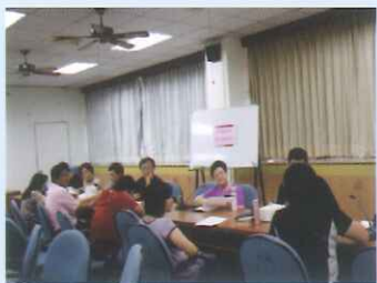
101學年度特殊教育推行委員會。