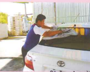
▲社區化實習：順力加油站。