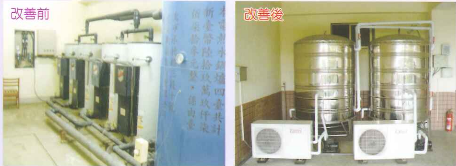
▲原有舊系統高耗電能電棒系統。 ▲新安裝兩套計四噸水量之熱泵熱水系統。