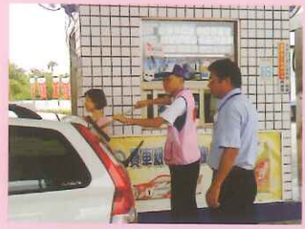
▲社區化實習：臺灣中油大義路路。