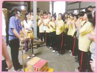
▲職場參訪：德星紙器廠。