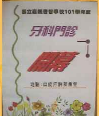
▲醫師仔細為學生進行口腔檢查與治療。 ▲牙醫師公會醫師至校提供學生牙科一般診療服務。