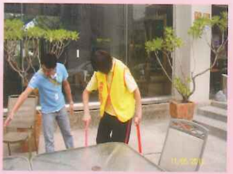
▲社區化實習：左阜右邑餐廳。