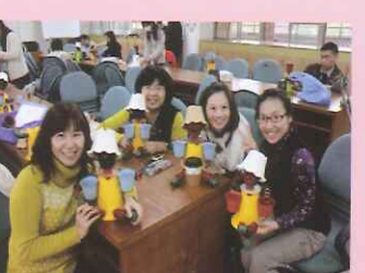
▲盆栽人偶製作研習。