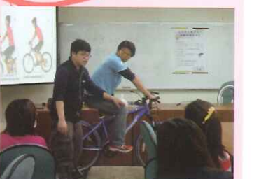
▲自行車之騎乘技巧與維修保養研習。