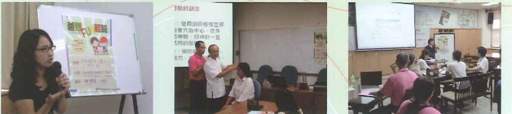
▲臨床心理師講演原生家庭對孩子發展之影響。

本學年度與嘉義市家教中心合作辦理一系列「爸媽放輕鬆-父母成長學苑」的親職教育講座，提供家長管教技巧與輔助財產宣告議題之討論，並安排紓壓按摩之講座，協助家長身心靈之放鬆。