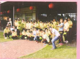
▲職場參訪：新港香藝文化園區。