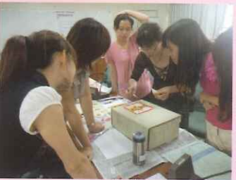
▲手工藝品製作(蝶古巴特基礎貼布)研習。