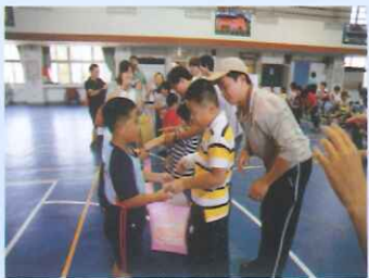
港坪國小融合活動－交換禮物。