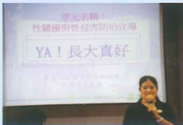
嘉義市警局婦幼隊進行防治宣導。