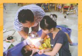
▲嘉義市牙醫師公會支援本校學生牙齒檢查服務。 ▲為學生進行牙齒檢查服務。