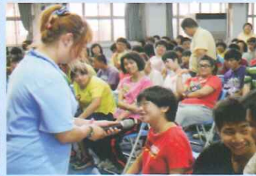
學生踴躍回答問題。