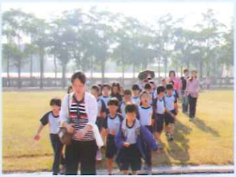
港坪國小融合活動－歡迎來我嘉。