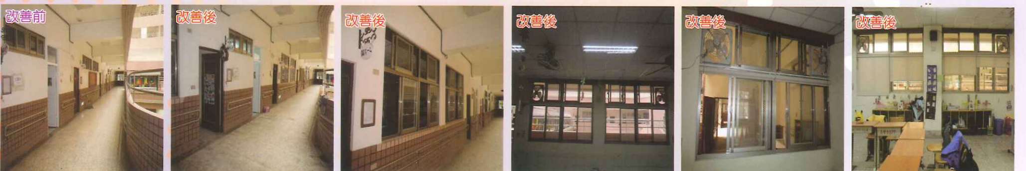
▲窗戶修改。 ▲加裝防眩陽光捲簾。