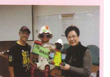
▲盆栽人偶製作研習。