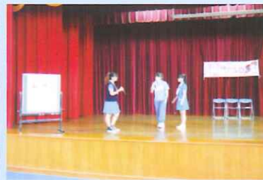
崇仁專校學生以話劇形式進行性教育觀念宣導。