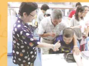
▲實施本學年度新生健康檢查。