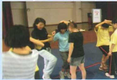
學生進行防身術演練。