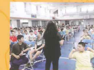
▲嘉舉行全校環境教育課程，主題：打造無菸、無毒的健康學習環境。