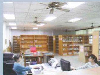
軟硬體完善的教材教具製作區