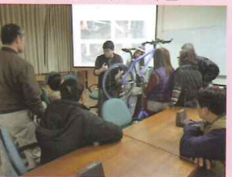
▲自行車之騎乘技巧與維修保養研習。