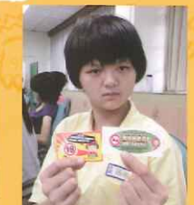
▲學生認真聆聽，了解菸害與毒品的壞處。 ▲加強宣導禁菸禁檳政策。