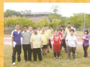
▲體重控制班全體同學合照。