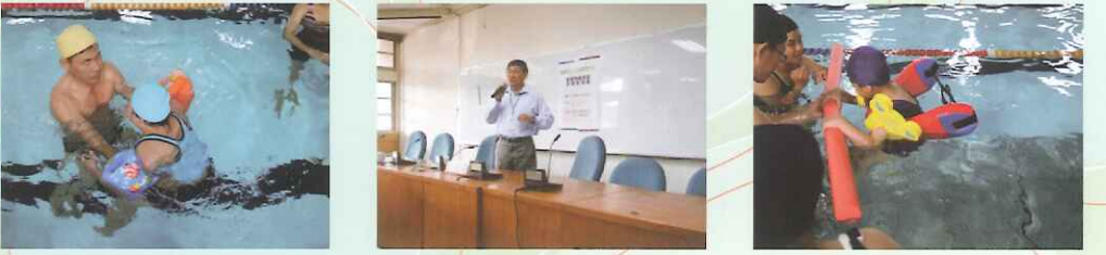
▲講師引導怕水的學生進行活動。

武而讓治療師以豐富經驗帶領老師、家長與學生進行水中運動，協助家長於日常生活中了解如何引領孩子「玩水」。