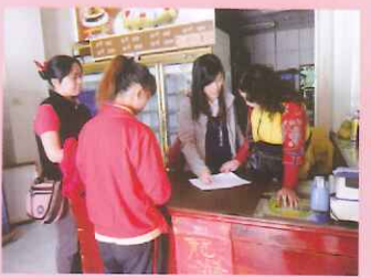
▲帶領學生至職場面試：米奇屋蛋糕坊。