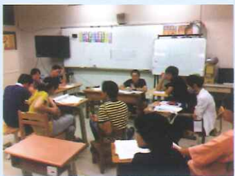
101學年度課發會國小部研討新課綱。