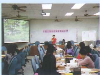
新進教師研習（校長代表全校教職員工生歡迎本學年度新進教師）。