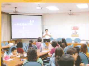
▲嘉義市消防局德安分隊救護科人員教導教職員急救知能與技術。