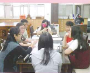
▲學生職業能力評量結果說明會。