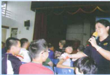
學生踴躍回答問題。