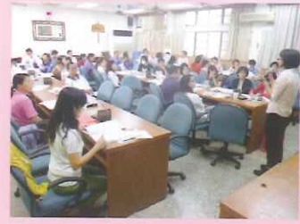
▲101年10月4日辦理嘉義區職業轉銜服務會議。