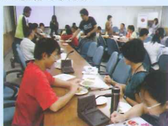
園藝治療研習－聞聞花草香一天好心情。