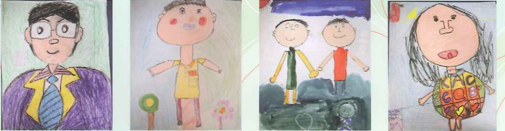
▲繪畫類 國中小組(包含幼稚部) 中一丙/張奕真 題目：我最喜歡的老師 指導老師：黃祺