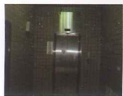
●教學大樓電梯車廂門寬度-改善前/改善後