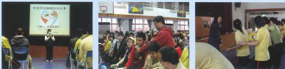
●委請嘉義市政府警察局婦幼隊進行宣導與進行女子防身術教學，教導學生辨識危險情境、自我保護與尊重他人身體之知識並學習自衛防身術。