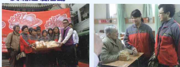
● 舉辦反哺送暖活動-至城煌廟贈送街友麵包 ● 校長帶領本校學生至大林老人院贈送學生親手烘焙的麵包