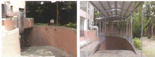
●廚房送貨坡道-改善前/改善後