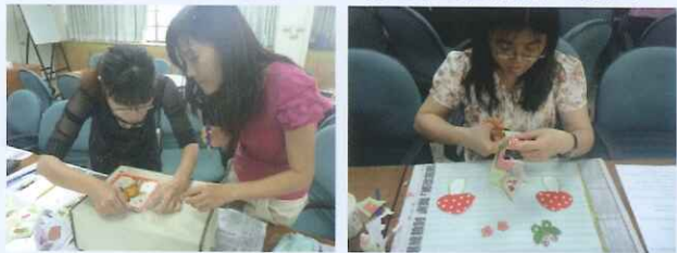
● 講師教導布織品上膠技巧 ● 在欲製作的布料上構圖