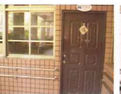
●室外通路坡道-改善前/改善後