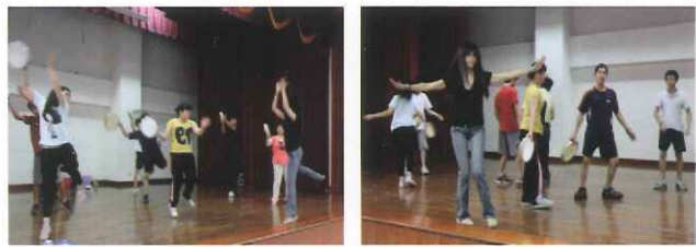
●高中職適性學習社區教育資源均質化方案 「打擊樂」音樂課程