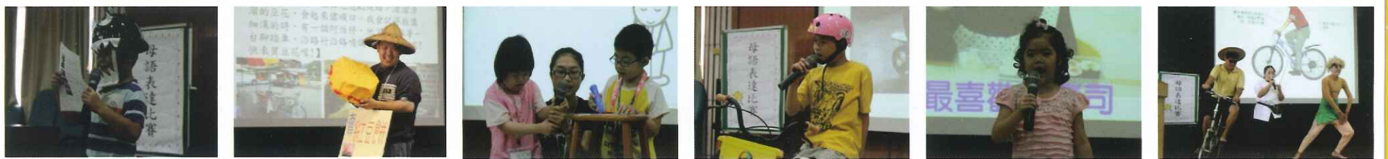
●學藝競賽「母語表達比賽」