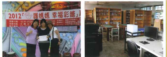
●社區參與-與北興幼兒園合辦 2012手護媽媽幸福彩繪活動 ●本校教材教具室完成搬遷囉! ~歡迎大家善加利用~