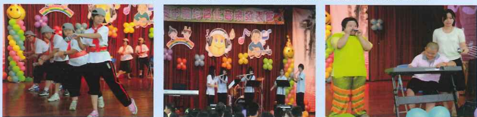
●5月23日下午，由嘉義高中音樂班學生與本校學生共同演奏，帶給大家一場特別的聽覺與視覺饗宴。