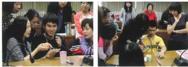
●高中職適性學習社區教育資源均質化方案 「打字溝通法」教師研習