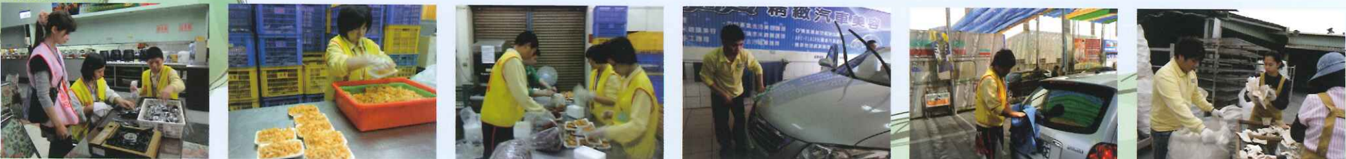
● 巡迴輔導老師了解學生在菩提樹餐廳實習的情形 ● 學生在全買大賣場實習 ● 學生在全買大賣場實習 食材分裝 ● 學生在車寶貝洗車場實習 手工洗車 ● 學生在威盛加油站實習 洗車 ● 學生在弘元皮革廠實習