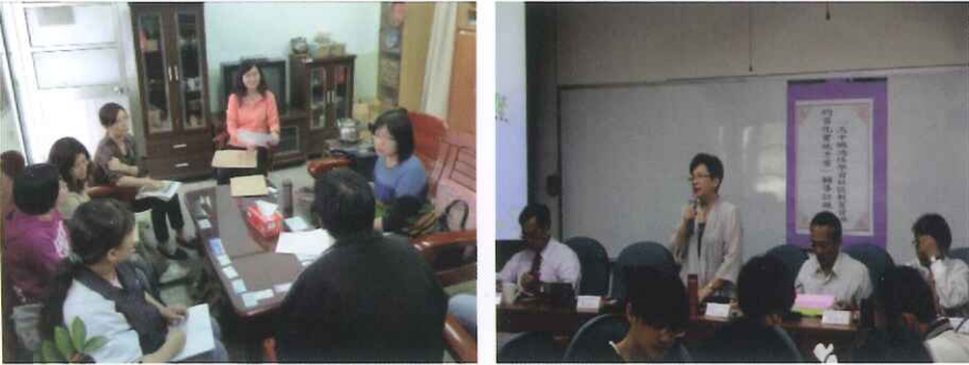
輔導訪視到校說明、到府拜訪 時間：101年2月~3月