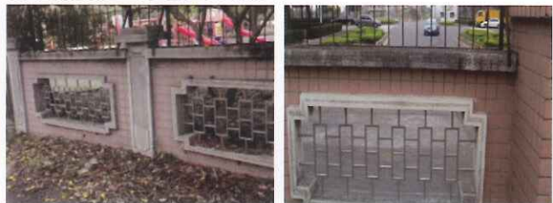
●本校鏤空圍牆以及鄰近的港坪運動公園-改善前/改善後