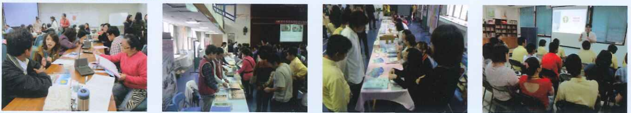
● 101.03.09 舉辦轉銜服務會議，安排家長與所屬社工人員個別諮詢 ● 101.04.06 舉辦轉銜博覽會，邀請就業、就養、就學資訊參展 ● 101.04.06 轉銜博覽會上，學生主動詢問社會福利資源 ● 101.04.27 帶領本校學生和家長參訪清健庇護工場。