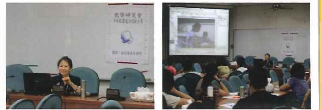
●教學研究會 「字母版溝通法」經驗分享