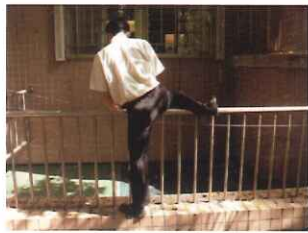
●職教大樓地下室採光天井-改善前/改善後