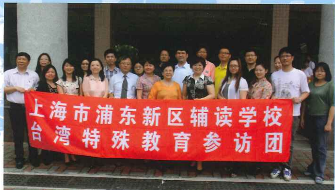
●本校同仁與上海市浦東新區輔讀學校參訪團成員，合影留念。

最後，本校同仁、家長會代表與上海市浦東新區輔讀學校參訪團的成員，於嘉智校園進行植樹紀念活動，象徵兩校友誼長存，也為此次姐妹校的交流活動，畫下圓滿的句點。