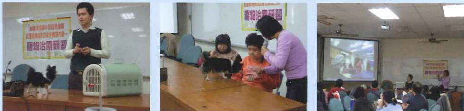
●藉由研習活動，增進教師與相關教育人員對多元輔助療法之瞭解，提升其相關知能。