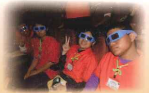
●台中科學博物館-3D立體劇院