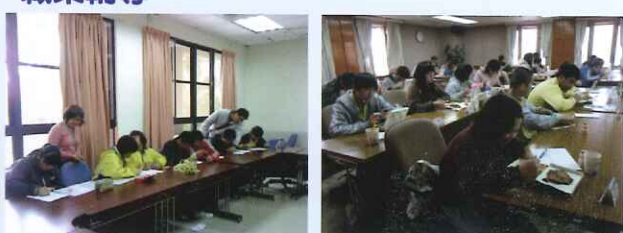
● 101.01.04 帶領學生參加佳能公司徵才活動 ● 101.02.25 輔導學生參加中油公司職前訓練