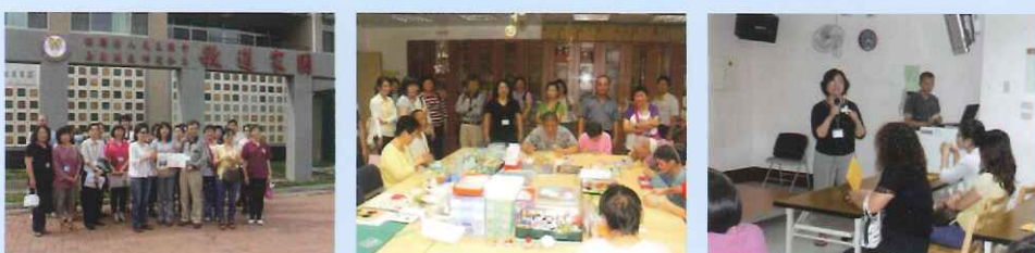
●針對未來有就養照顧需求學生的家庭，綜合家長意願及本校社工師專業建議，從鄰近縣市選擇較適合安置之場所，辦理轉銜機構參觀活動。