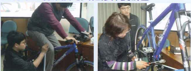
● 正確騎乘姿勢教學 ● 學員操作自行車簡易維修方法