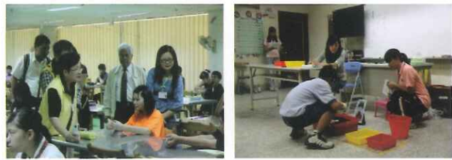
●十二就學安置能力評估