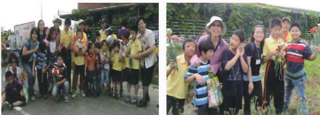
●嘉義市育人國小母親節系列活動 「溫馨五月天幸福滿花田」