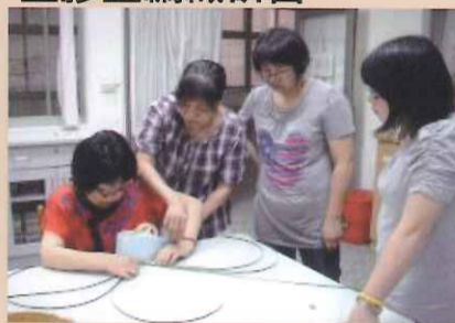
基本編法及注意事項介紹