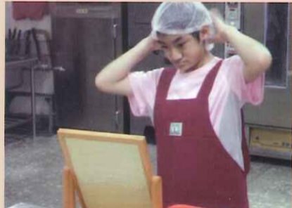
戴上網帽 整理儀容