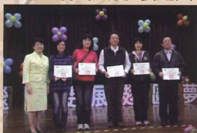
感謝轉銜單位熱情贊助活動