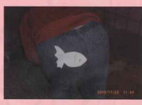
☆達云，妳在找什麼？魚兒不在下面啦！