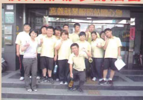
嘉義就業服務站求職登記