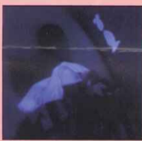
☆中信的特殊擺位方式，躺於豆袋上時，由於張力影響，大多看向左側，於牆上貼魚增加視覺刺激。

我想不管是在平常的教室或是多感官教室裡，經由課程設計及適性的教學引導，老師都能提供學生多感官的刺激。多感官教室中的設備只是一種媒介，讓老師可以方便的運用來進行更有效、更多樣化的多感官教學。