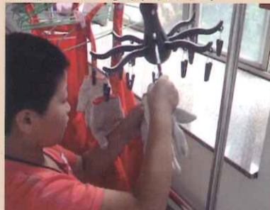
晾曬棉紗手套後即完成工作