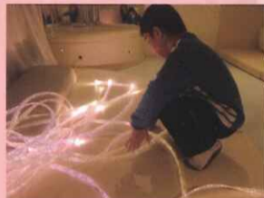
☆智中的反應最妙，從一開始陌生、抗拒，到眼睛可以去注視、去摸，到最後自己掀開衣服玩。(緞帶光纖)