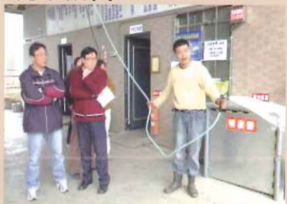
基本編法及注意事項介紹