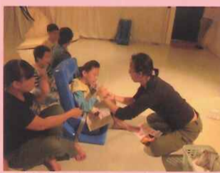
☆柏丞以字卡選擇方式決定他想體驗的多感官設備。

除上之外，進行這些課程活動時，會有職能或是物理治療師適時地協同教學，他們除了協助學生擺位及動作外，會視個別學生情況給予專業協助，讓學生能更適性地參與活動。