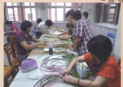
參與研習老師認真製作