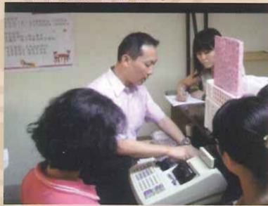
櫃檯作業收銀機基本使用操作示範