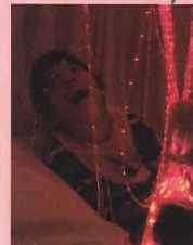
☆進入多感官教室，課程比平時多話，想去玩時，自己會奮力地用屁股挪到想去的地方。

我想不管是在平常的教室或是多感官教室裡，經由課程設計及適性的教學引導，老師都能提供學生多感官的刺激。多感官教室中的設備只是一種媒介，讓老師可以方便的運用來進行更有效、更多樣化的多感官教學。