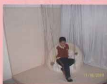
☆看我坐的多舒服，你也來試試嗎？(角落空間組)