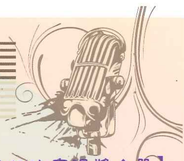
【國中小卡拉OK比賽得獎名單】