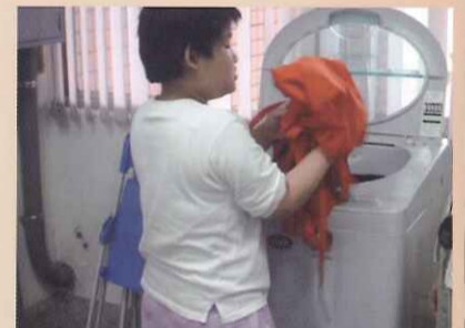
拿出洗淨的衣物放置「已清洗」籃中