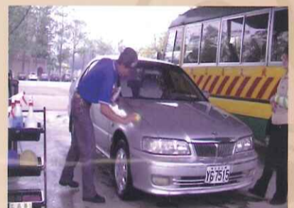
參與研習老師認真製作