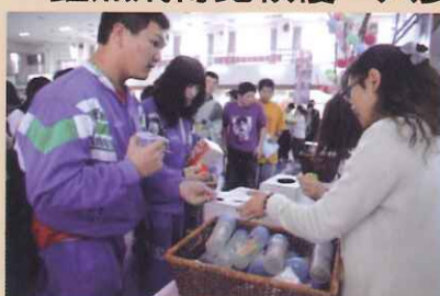
抽獎活動人人有獎