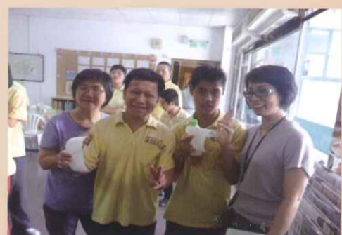
南陽化學工業股份有限公司