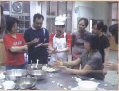
老師講解示範麵皮展開技巧