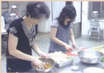
咖哩餃內餡料處理