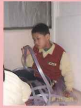
☆瞧！柏宇看的多專注，專注到忘了要摸耳朵(他有摸耳朵的行為)