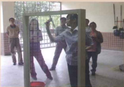
清潔玻璃~玻璃刮刀使用