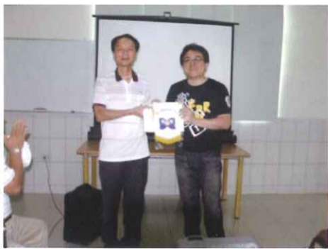
(參觀若竹兒啟智發展中心)