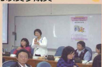
轉銜會議師生家長意見交流