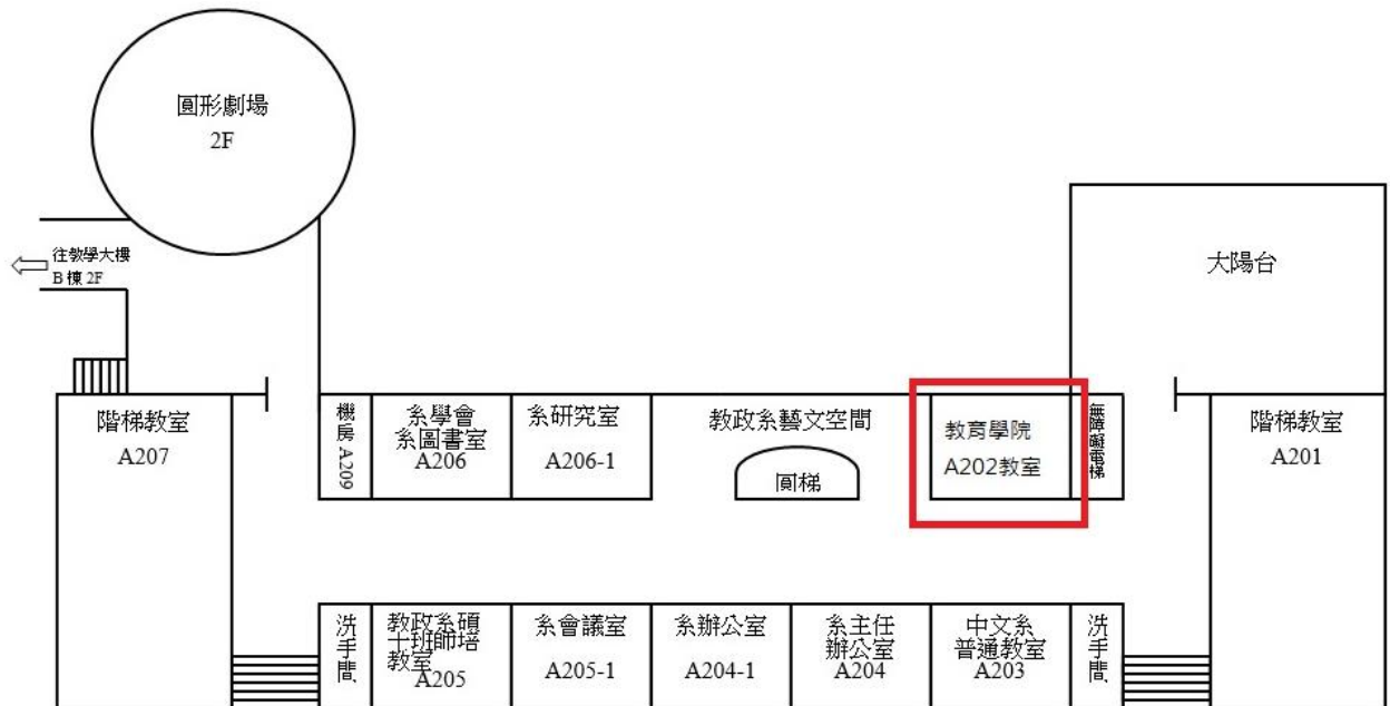
教育學院二樓平面圖