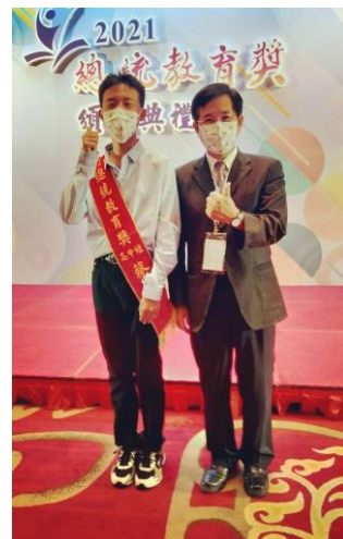
與教育部潘文忠部長合影

自 5 月 19 日停課不停學至今，學生待在家裡已經有好一段時間了，終於疫情緩和，懷著歡欣鼓舞的心情迎接新學年的到來，我們嘉特「專業特教希望學園」正緊鑼密鼓地舉辦各項研習，包括校車司機、隨車人員性平研習、全校教職員工的性平知能研習、法律研習及網路安全知能研習，期待在新的一年提升師資專業知能，讓嘉特的學生得到最適切的照顧，並成就每一個孩子，適性揚才，讓孩子成為終身學習者，符應十二年國教「自發、互動、共好」的理念。